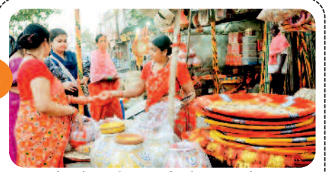
गुड़े और गुड़िया खरीदने पहुंच रहे ....