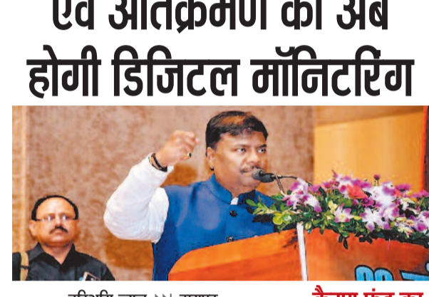
हरिभूमि न्यूज ▶▶ रायपुर

कैम्पा फंड का पूरा उपयोग करें वनमंत्री ने विभाग के अधिकारियों से कहा कि 2024-25 एवं 2025-26 के सभी स्वीकृत कैम्पा कार्यों का 100 प्रतिशत व्यय सितंबर 2026 तक हर हाल में पूर्ण किया जाए। किसी भी स्थिति में फंड लैप्स स्वीकार्य नहीं होगा। भूमि संबंधी समस्याओं के निराकरण के लिए लैंड बैंक व्यवस्था को सुदृढ़ करने पर जोर दिया गया, ताकि विकास कार्यों में अनावश्यक देरी न हो। वहीं वनप्राणी प्रबंधन योजना में गुणवत्ता सुधार, व्यय वृद्धि तथा संबंधित अधिकारियों की जवाबदेही सुनिश्चित करने कहा।